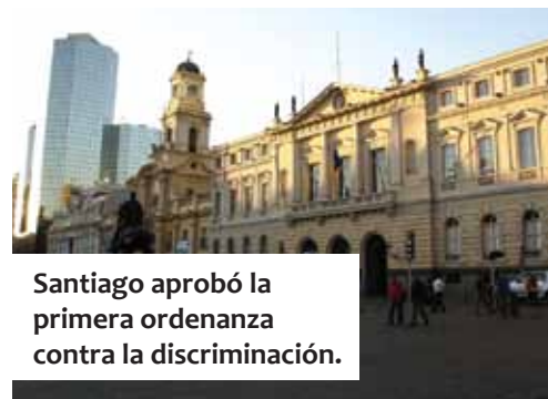
Santiago aprobó la primera ordenanza contra la discriminación.