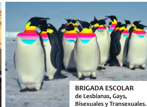
BRIGADA ESCOLAR de Lesbianas, Gays, Bisexuales y Transexuales.