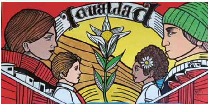
R. de Tarapacá / Jorge Castro Alday / 8 de julio de 2017