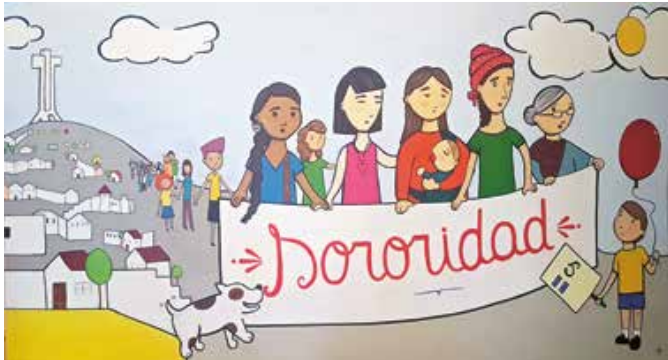
R. de Coquimbo / Carolina Ponce de León Escobar / 5 de agosto de 2017