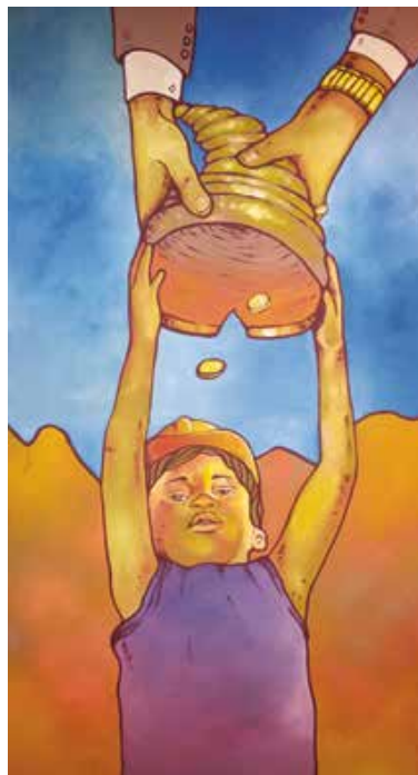
R. de Atacama / Iván Jorquera Olivares / 22 de julio de 2017