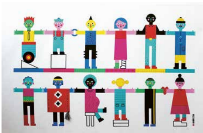
R. de Valparaíso / Michelle Koryzma Reid / 5 de agosto de 2017

Para su conocimiento, la información sistematizada de los diálogos por región se encuentra disponible en www.planderechoshumanos.cl