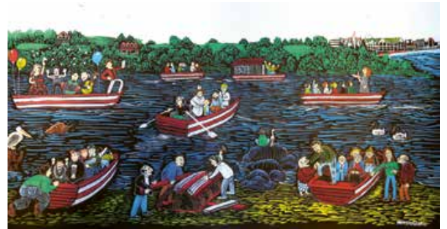
R. de Los Ríos / Magdalena Armstrong Olea / 8 de julio de 2017