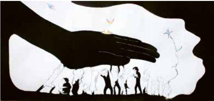
R. de O'Higgins / Leonel Arregui Santander / 5 de agosto de 2017