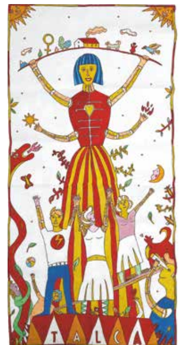
R. del Maule / Héctor Calvo Dragosevic / 15 de julio de 2017