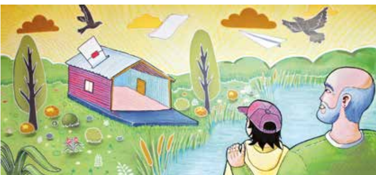
R. del Biobío / Joel Bustos Barrueto / 15 de julio de 2017